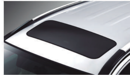
● TECHO SOLAR