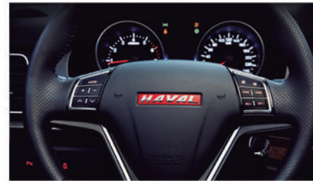
● VOLANTE FORRADO EN CUERO, CON SISTEMA MANOS LIBRES, BLUETOOTH Y CONTROL CRUCERO INCORPORADO