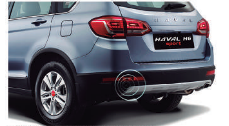
● SENSORES DE PARQUEO DELANTEROS Y TRASEROS