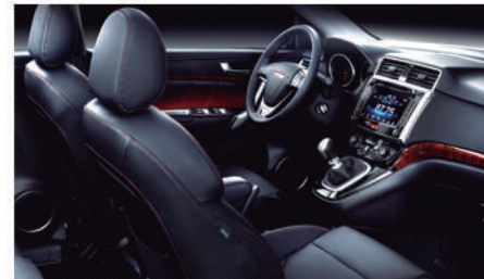
● DISEÑO INTERIOR LUOSO Y DEPORTIVO