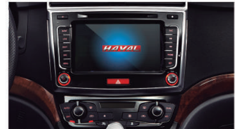
● PANTALLA TÁCTIL LCD DE 8 PULGADAS, LA CUAL OFRECE VARIAS FUNCIONES RECREATIVAS DE FÁCIL MANEJO